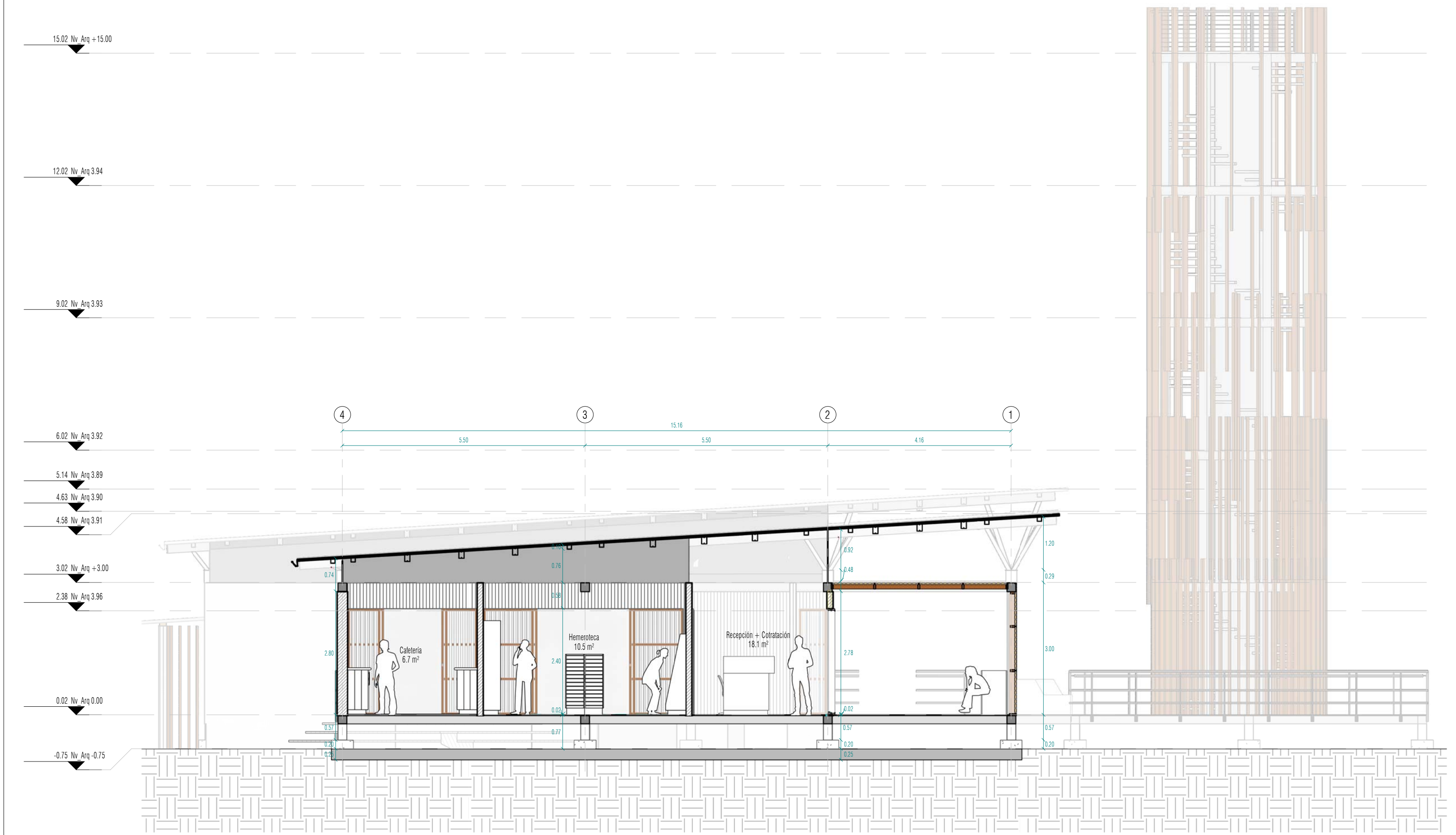
Sección E-E 1:75